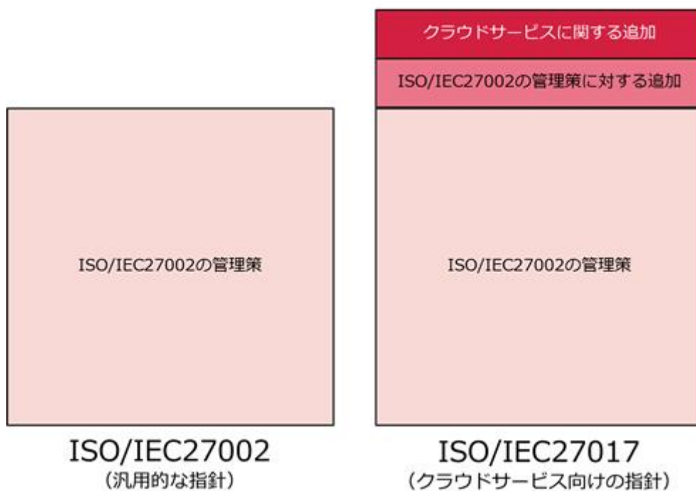
図2. ISO/IEC27002 とISO/IEC27017の体系イメージ

「ISO/IEC 27002 の管理策に対する追加の実施の手引き」と「クラウドサービスに対する追加の管理策及び実施の手引き」 ISO/IEC27002 は情報セキュリティマネジメントの汎用的な指針であるのに対し、ISO/IEC27017 はクラウドサービス向けの指針です。ISO/IEC 27002 を前提とした ISO/IEC 27017 には、ISO/IEC 27002 に対して、クラウドサービスに固有の事項を追加されています。具体的に、ISO/IEC27017 には、以下の内容が記載されています。